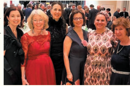
Das Ballkomitee